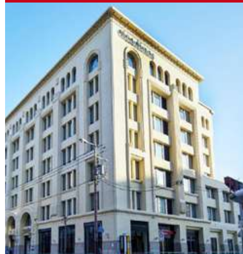
Citatines Namba Osaka