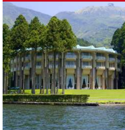
The Prince Ashinoko