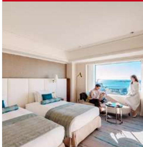
Grand Nikko Daiba