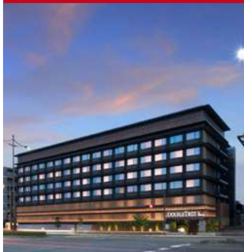
Double Tree Higashiyama