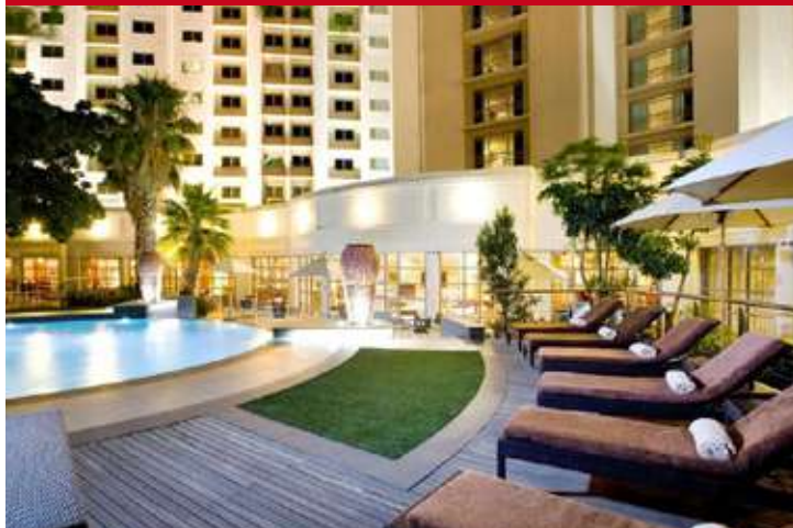
Southern Sun Waterfront