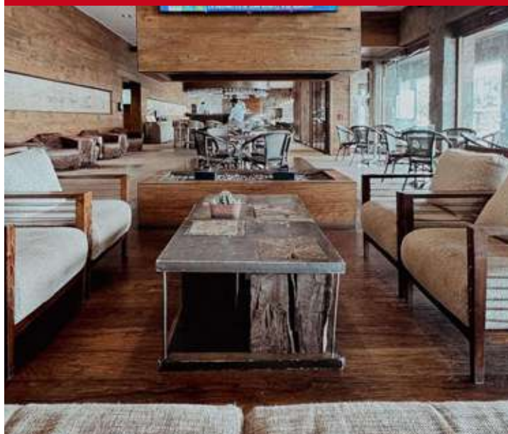
Radisson Puerto Varas